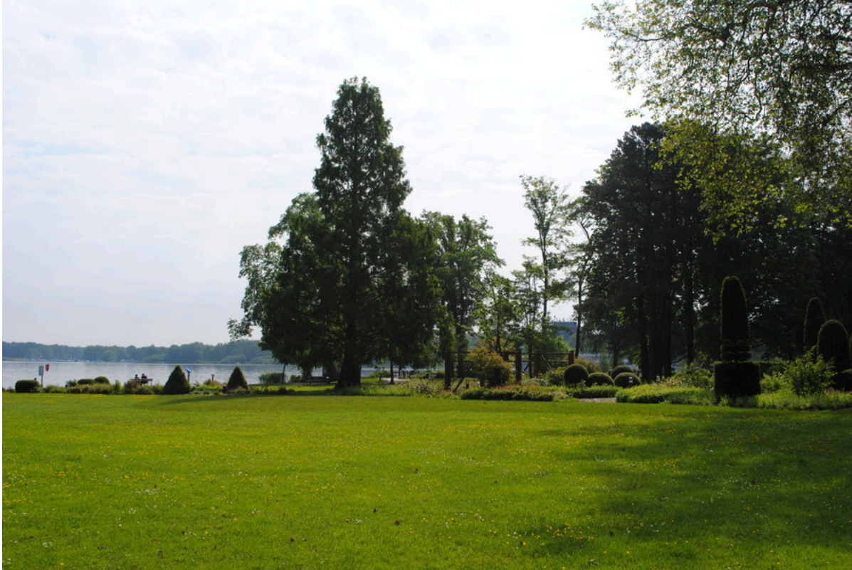
Kurpark Bad Zwischenahn