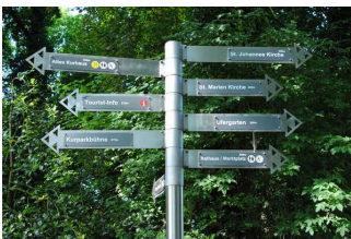
Bedienelemente / Leitsystem