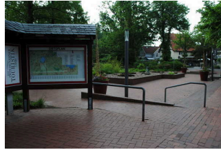
Eingang an der Touristinformation