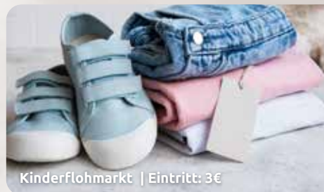
Kinderflohmarkt | Eintritt: 3€