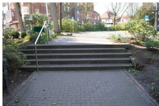
Stufen auf dem Weg vom Parkplatz zum Eingang