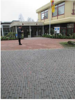
Weg Parkplatz bis Eingang Wandelhalle