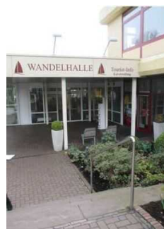
Bild von Eingangsbereich

Der Eingangsbereich ist visuell kontrastreich zur Umgebung abgesetzt.