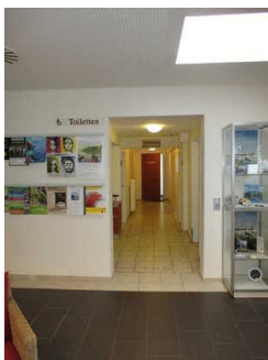
Flur/Gang zum WC