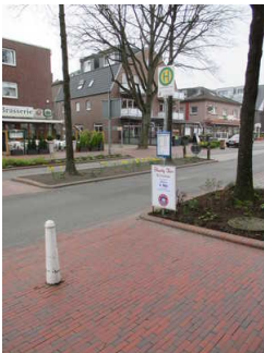
Bushaltestelle "Auf dem Hohen Ufer"