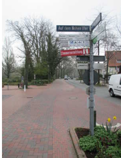
Wegweiser zu Tourist-Info und Wandelhalle

Die Beschilderung ist in gut lesbarer Schrift gestaltet.