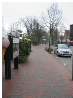
Weg zur Wandelhalle