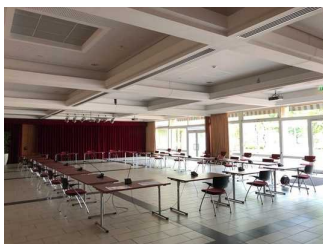
Der Saal ist individuell bestuhlbar.