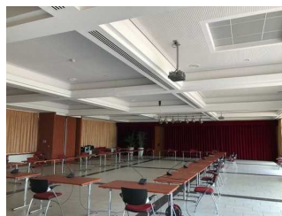
Saal und Tagungsraum "Wandelhalle"