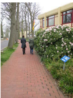
Weg zur Wandelhalle