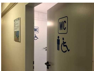
Das WC für Menschen mit Behinderung (Herren) ist in den Sanitärraum integriert.