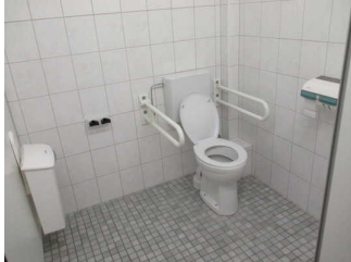
Kabine öffentliches WC Damen