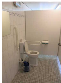
Kabine öffentliches WC Herren