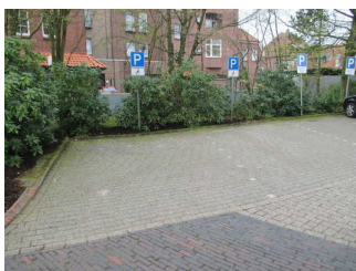
Stellplätze für Menschen mit Behinderung