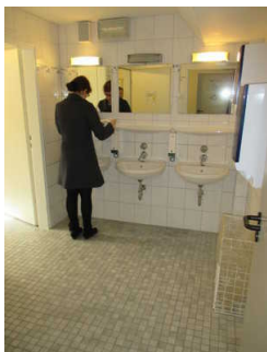
Vorraum öffentliches WC Herren