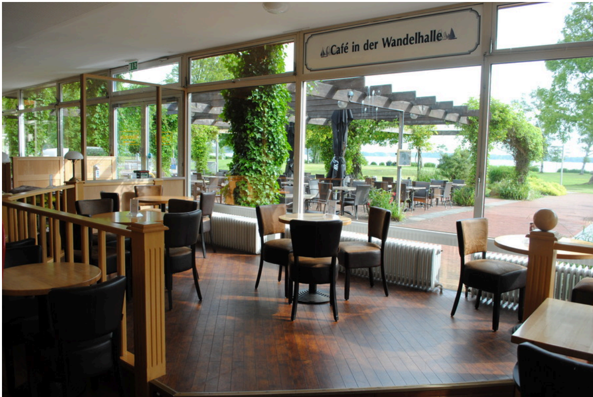
Café in der Wandelhalle Bad Zwischenahn