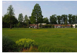
Café in der Wandelhalle Bad Zwischenahn