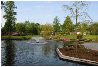
Café in der Wandelhalle Bad Zwischenahn