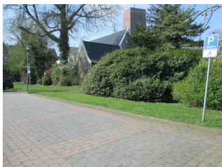
Parkplatz am Dränkweg

Es ist kein betriebseigener Parkplatz vorhanden.