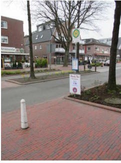
Bushaltestelle "Auf dem Hohen Ufer"

In ca. 250 m Entfernung befindet sich die Bushaltestelle "Auf dem Hohen Ufer". Die Haltestelle ist bildhaft gekennzeichnet und es gibt schriftliche Haltestelleninformationen. Man erreicht die Bushaltestelle z.B. mit den Buslinien 394 und 398 vom Bad Zwischenahn ZOB.