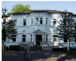
Altes Kurhaus mit Eingangsbereich