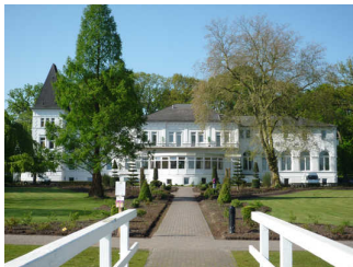
Altes Kurhaus von der Meereseite