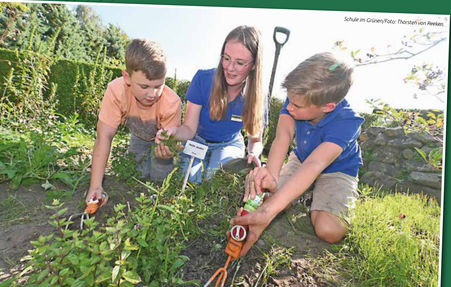
Schule im Grünen

Zu den Kooperationspartnern zählen das Umweltbildungszentrum Ammerland, der Bund Deutscher Baumschulen Weser-Ems, der Imkerverein Bad Zwischenahn/Westerstede, der Verband Garten-, Landschafts- und Sportplatzbau Niedersachsen-Bremen und der Oldenburgisch-Ostfriesischer Wasserverband (OOWV).